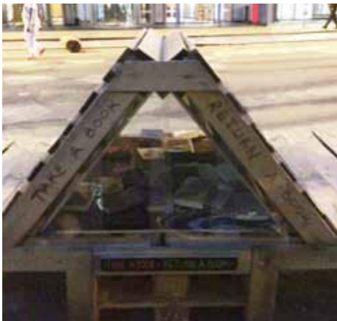
退役后的托盘继续服务社会