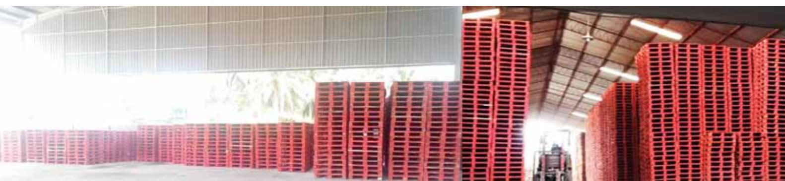
路凯印尼新三宝壟市仓库