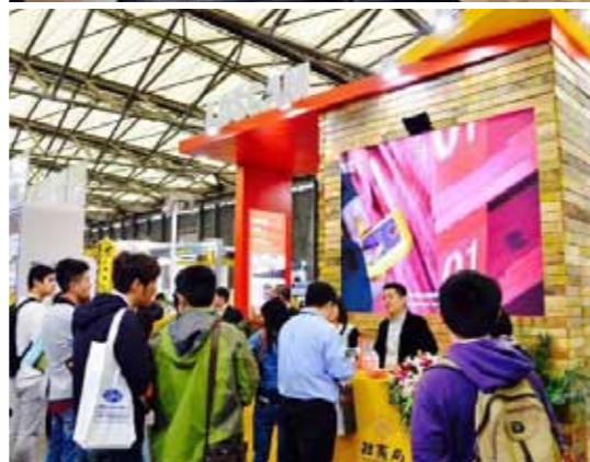
路凯展台吸引了很多在场人士参观,并开展了讨论